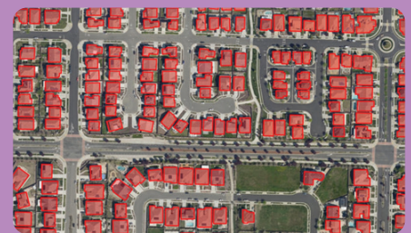
שימוש בטכנולוגיית AI למיפוי אוטומטי

זו הזדמנות ייחודית לרשויות המקומיות לאמץ את טכנולוגיית המידע המרחבי המתקדמת ביותר בעולם ולהשפיע באופן משמעותי על איכות ורווחת חיי התושבים והעובדים. רשויות שיצטרפו לתוכנית עד סוף השנה יקבלו מתנת הצטרפות אטרקטיבית במיוחד! לבדיקת זכאות להצטרף לתוכנית ולפרטים נוספים אתם מוזמנים לפנות לאסף רוזנפלד (פרטי קשר מצוינים מטה).