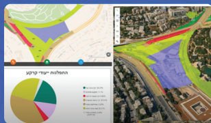
יישום משולב לתכנון בתלת ממד

בזמן קצר מאוד ניתן לספק תוצרים עשירים אשר מאפשרים לרשות לייעל תהליכי עבודה ולהציג תוצאות מרשימות. בצורה כזו ניתן במהירות להכין יישומים בעלי ערך רב עבור כל המחלקות בעירייה: חינוך, רווחה, הנדסה, תכנון, בטחון, נגישות, גבייה, דוברות, תחבורה ועוד.